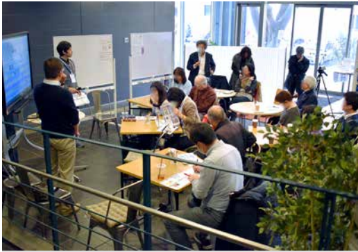
明るいカフェで和やかなやり取りが進みます

参加者： 実際飲んでも大丈夫なんですか。100に比べると100倍大きいわけじゃないですか。