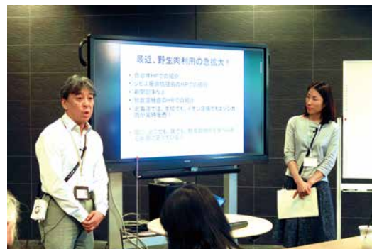
野生肉利用拡大の背景を解説