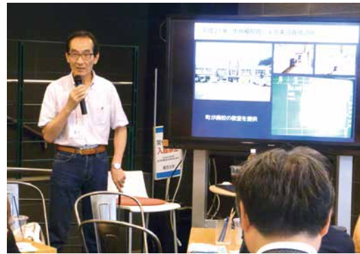
トラフグを養殖する様子を写真で紹介

かを調べた。そうしたら1匹も毒化してない。それで、厚生労働省にデータを持って行って許可してくれと言ったんですけども、駄目でした。その理由は、日本語には「万が一」という言葉があります。それで5,000匹では駄目なんでしょう(笑)。本当に5,000匹調べたんですよ。でも、真面目な話、もし1人でも死んだら、まずいですよ。だから、許可しないのは当然だと思います。