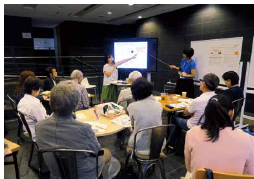
参加者からの問いかけが貴重な対話につながります