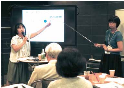
食物アレルギーが起きる仕組みを詳しく図解

アレルギーは、免疫系の攻撃対象となったアレルゲンに対するIgE抗体が患者さんの中できて症状が現れます。「抗原特異性」といいますが、IgE抗体には抗原特異性があり、だからこそ患者さんのアレルゲンを特定できるということになります。食べてすぐ吐いたり、じんましんがバーッと出てくる、そういった即時型のアレルギーでは、IgE抗体が重要な働きをしています。