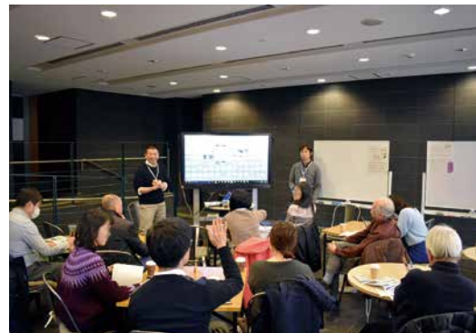
質問しやすい雰囲気に対話がはずみます