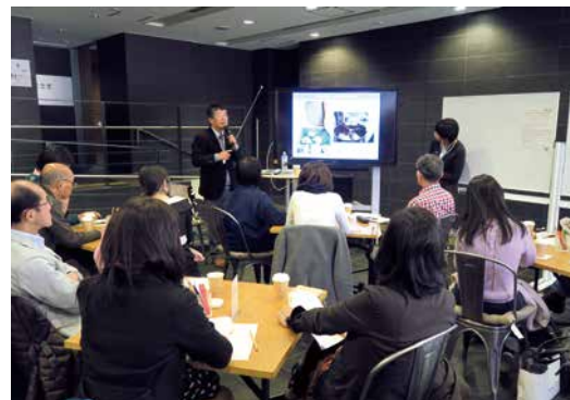
資料画像を共有しながら理解を深めます