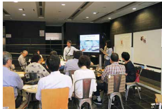
カフェならではの近さが魅力

【続きはホームページで】 http://www.frc.a.u-tokyo.ac.jp/information/news/171012_report.html