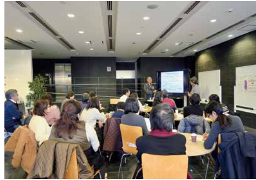
身近な食品の「毒性」の話に熱い注目が